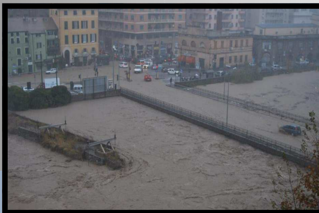
Genova, 4 novembre 2011

Coordina: G. Seminara , Università di Genova.